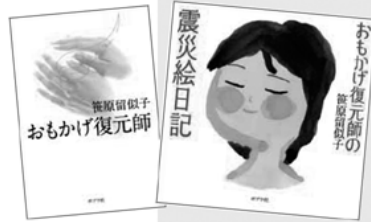
「おもかげ復元師」・ポプラ社